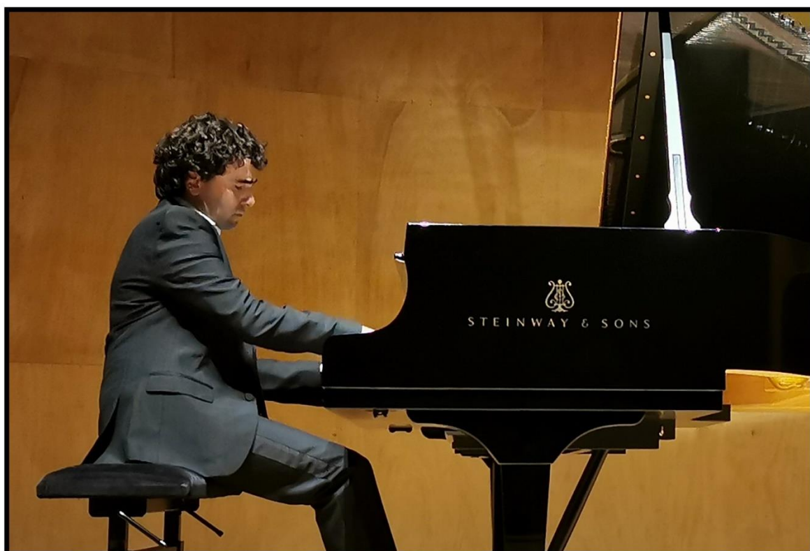
Ingmar Lazar, en récital à la salle Cortot, le 18 octobre 2023